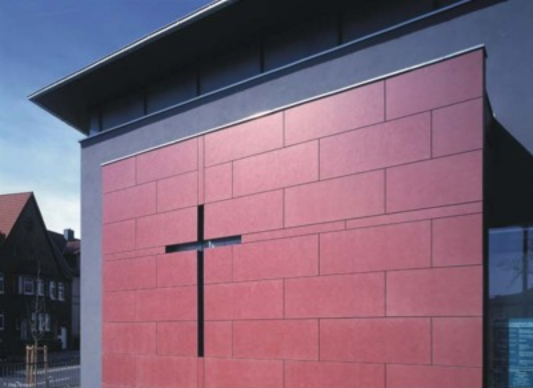
Die Kreuzwand fokussiert zum Götter Platz