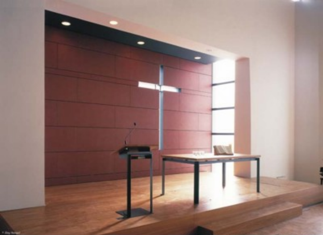
Das Taufbecken ist in das Podest integriert und mit einer Holzplatte abgedeckt