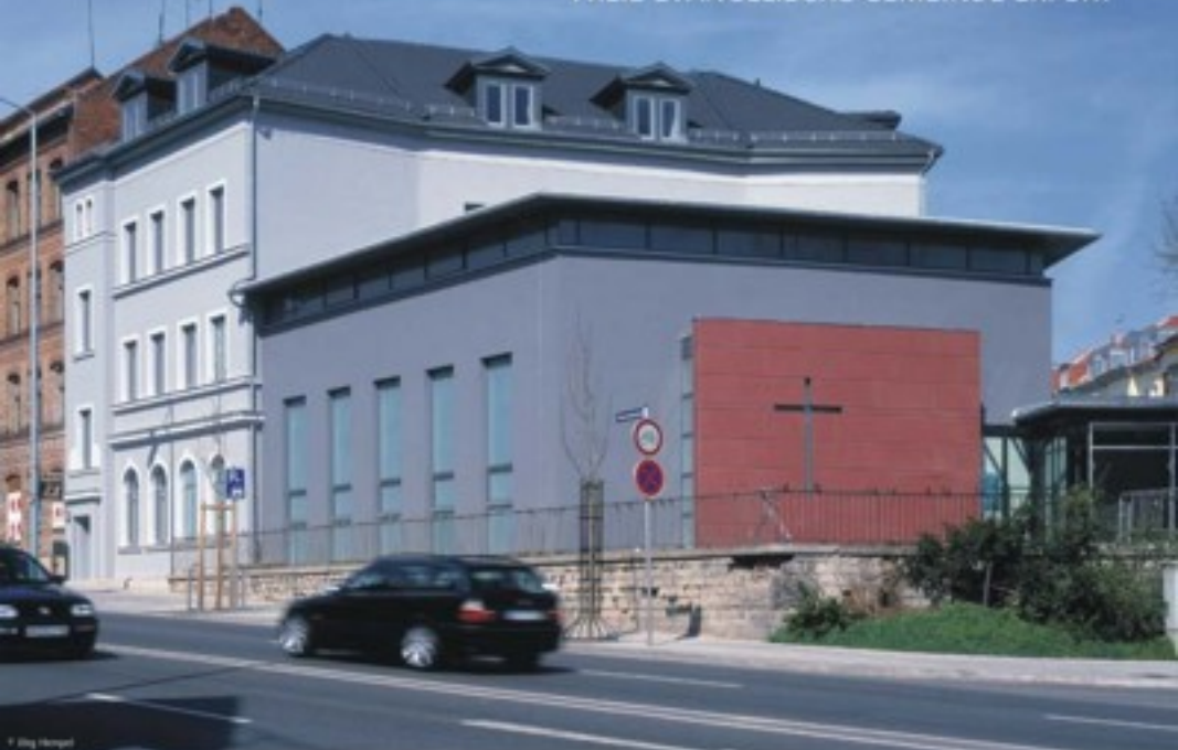
Blick auf das Gemeindezentrum am Gothaer Platz

Gebäude Das von der FeG Erfurt gekaufte ehemalige "Klubhaus der Mikroelektroniker" liegt direkt am stark befahrenen Verkehrsknotenpunkt Gothaer Platz in Erfurt. Durch die Sanierung entstand hier ein Gemeindezentrum mit einem Saal, 5 Gruppenräumen und 3 Wohnungen von 80–120m 2 .