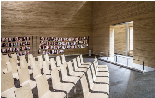
EFG Karlsruhe, PIA Architekten, 2012