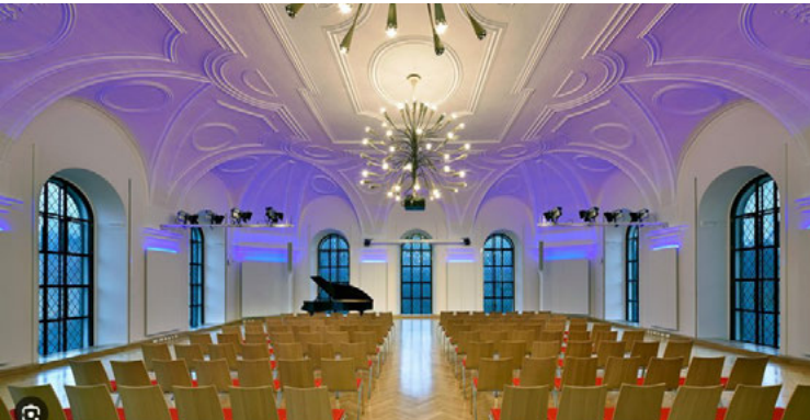
Kreuz und Quer Erlangen, 2016