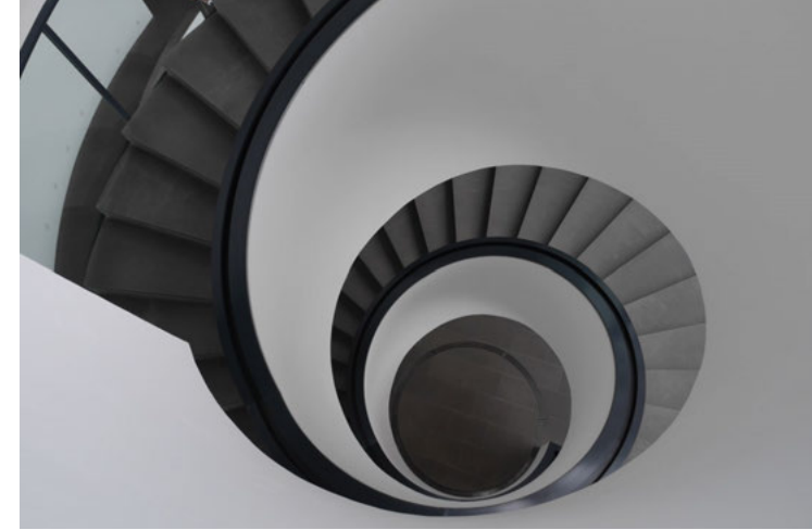
Neues Museum, Volker Staab (2000)

Weitere Einzelheiten werden noch bekanntgegeben