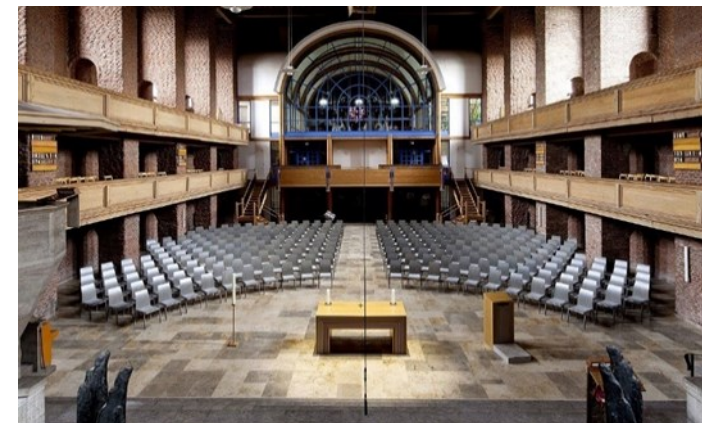
Gustav Adolf Kirche, Umbau 1990, Theo Steinhauser