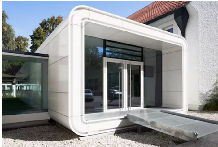
Lux Jugendkirche, 1986, Roland Noerpel

Weitere Einzelheiten werden noch bekanntgegeben